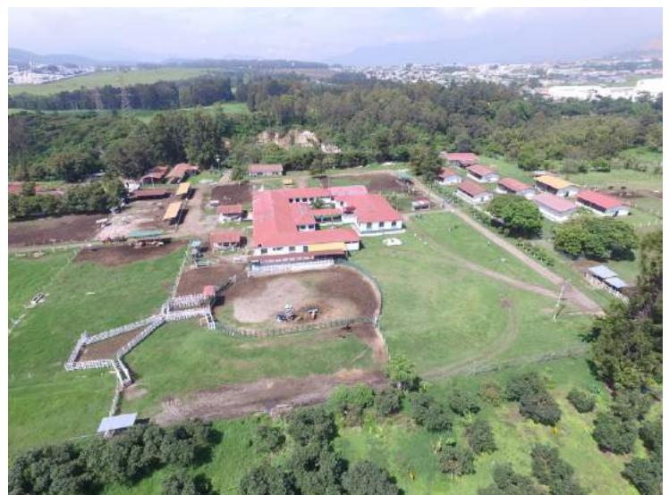
ENCA, Km. 17.5 Carretera a Bárcena. Villa Nueva, Guatemala

La ENCA abre sus puertas cada año para que jóvenes estudiantes de todo el país tengan opción a ser seleccionados para obtener una beca de estudios.