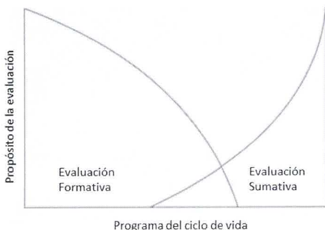
Grafico 02: Temporalidad y relación entre los componente a ser evaluados y propósito de la evaluación en su fase de implementación