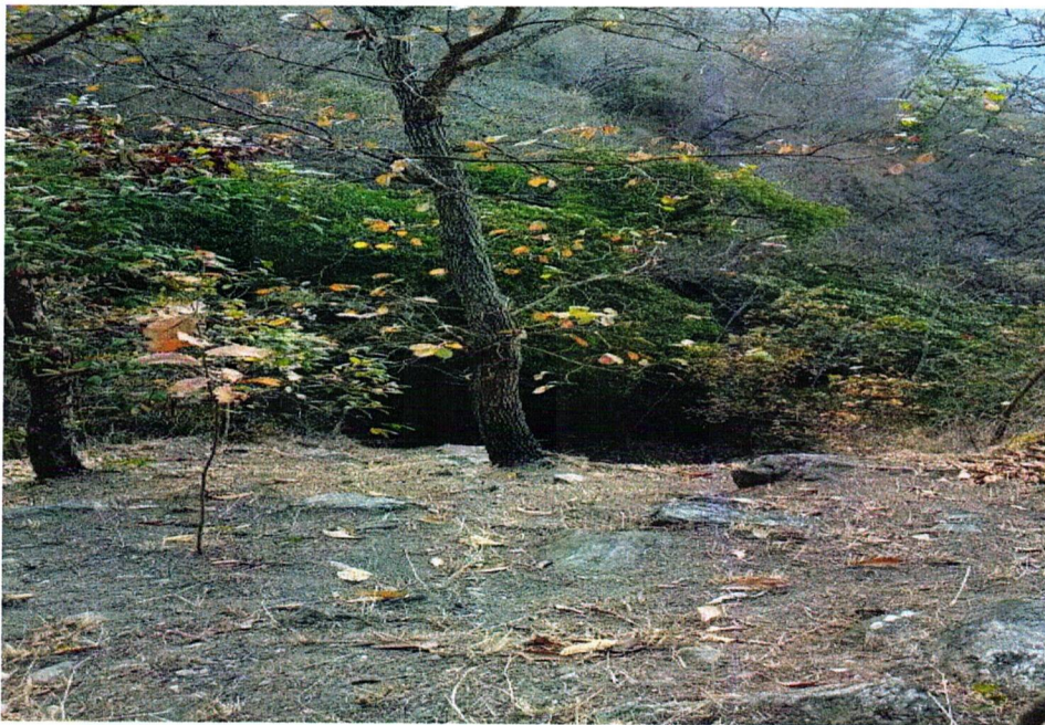
IMAGEN 2. Ronda Cortafuego en la Quebrada el Limón