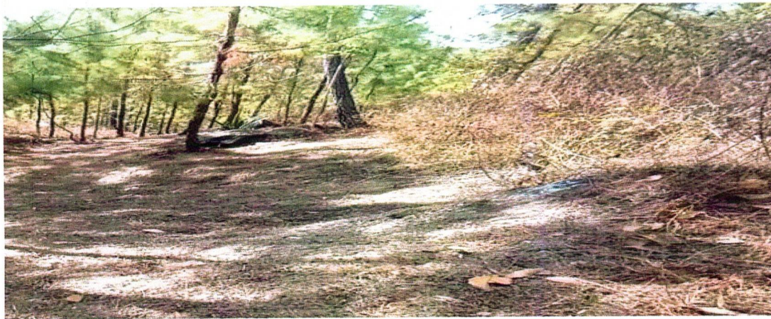
IMAGEN 3. Ronda cortafuego la quebrada donde Don Chus