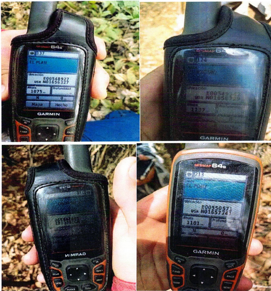
IMAGEN 5. Toma de coordenadas en áreas de la finca para implementación de café.