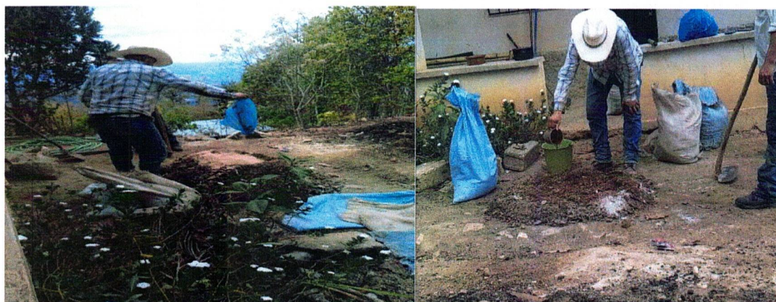
IMAGEN 4. Elaboración de aboneras tipo Bocashi.