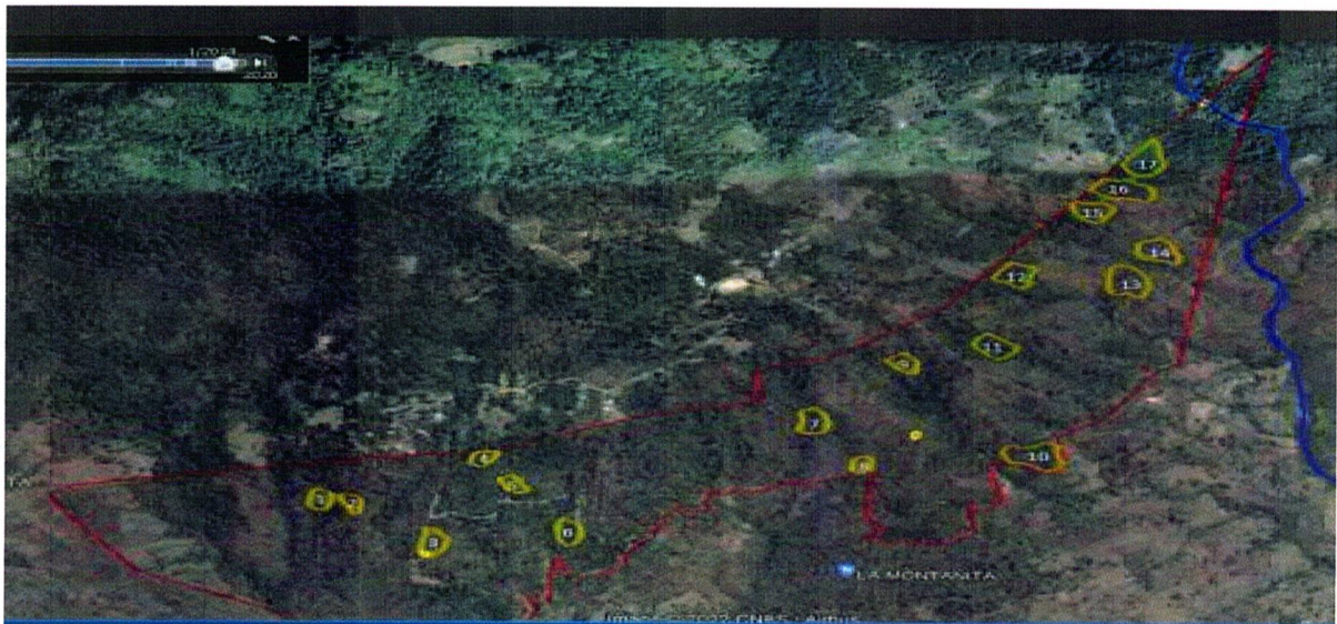
IMAGEN 6: DISTRIBUCION DE AREAS PARA REMEDIR AREAS