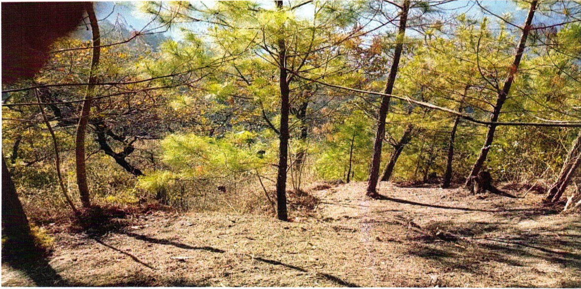
IMAGEN 1. Ronda cortafuego por la quebrada el Castellano