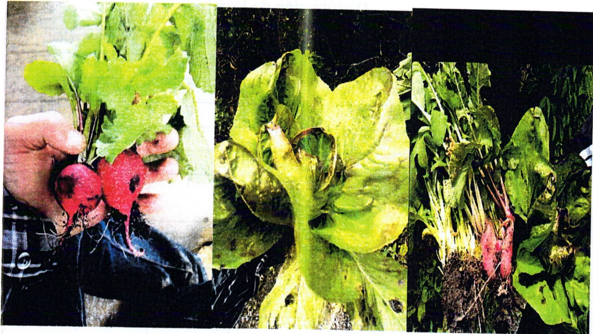
IMAGEN 1A: COSECHA DE ALGUNAS PLANTAS DE HUERTOS (RABANO, ACHICORIA, ACELGA, CILANTRO)