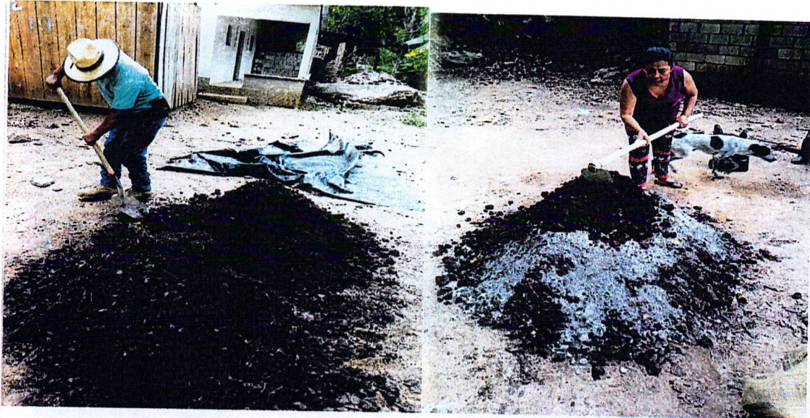
IMAGEN 2A: Elaboración de aboneras en la comunidad El Conacaste.