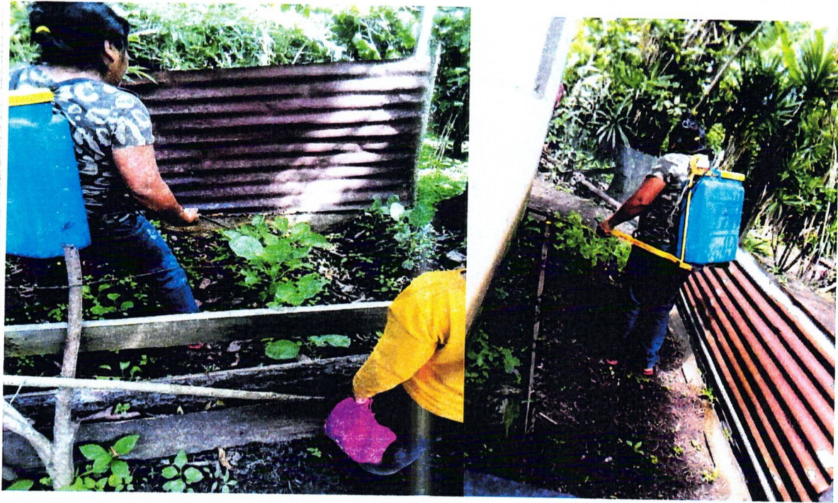
IMAGEN 6A: APLICACIÓN DE INSECTICIDA ELABORADO EN CASA A PLANTAS QUE AUN ESTAN EN DESARROLLO