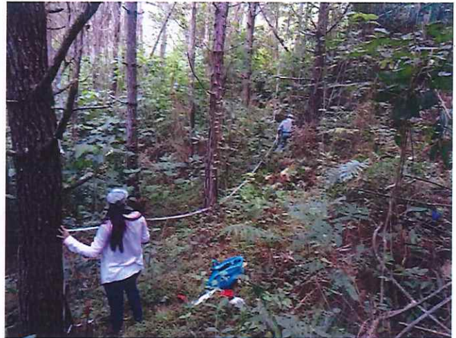
Fotografía 3. Delimitación de la Parcela