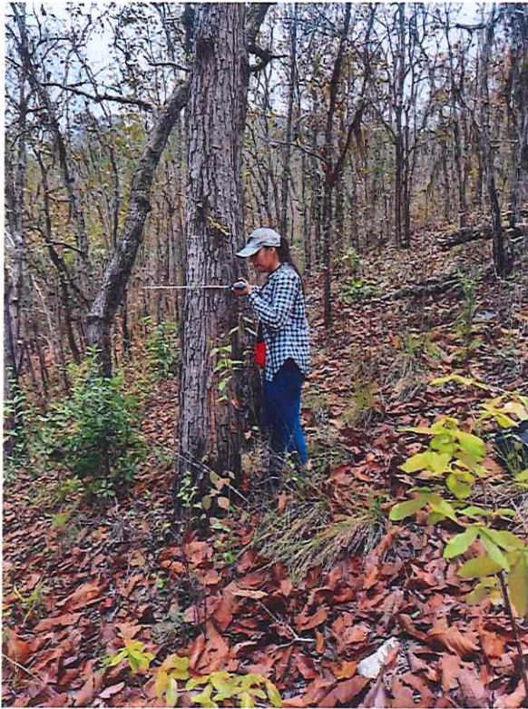
Fotografía 2. Toma de Diámetro a la altura de pecho