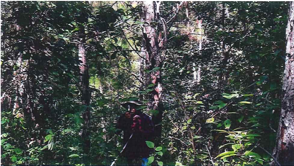
Fotografía 1. Toma de altura total de los árboles dentro de la parcela