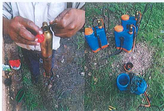
Anexo. 8. Capacitación acerca del manejo, mantenimiento, calibración del equipo de aplicación y elaboración de mezclas químicas.