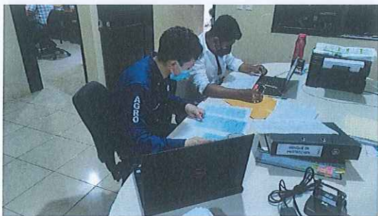
Anexo. 1. Acompañamiento y asistencia técnica sobre documentos contables necesarios para generar liquidación parcial.