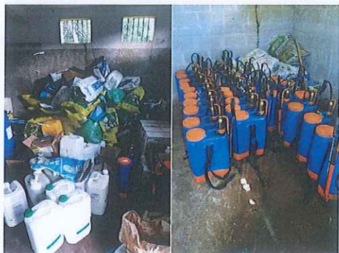
Anexo. 7. Reacondicionamiento de la bodega y generación del inventario.