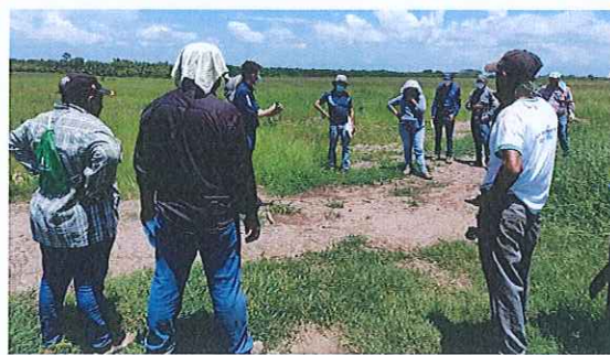
Anexo. 6. Capacitación mediante la técnica dirigida a grupos operativos "campesino a campesino" por medio de la toma de coordenadas delimitación del bosque energético.