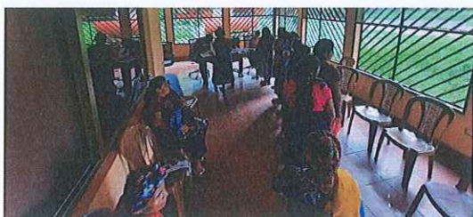
Anexo. 3. Convocatoria y recolección de firmas.