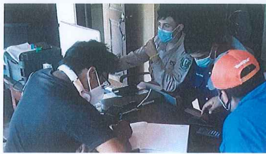
Anexo. 2. Corrección de documentos y tutoría de redacción y uso de herramientas electrónicas a junta directiva.