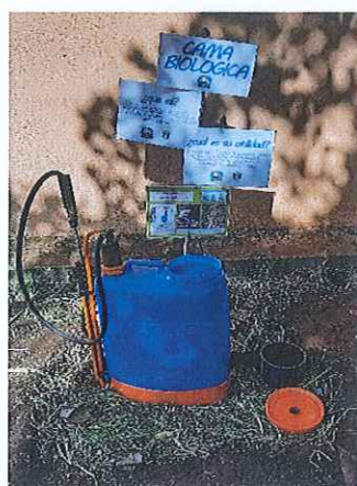
Anexo. 10. Cama biológica implementada.