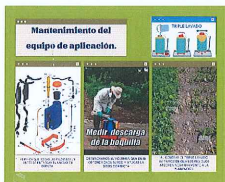
Anexo. 9. Material de apoyo para la capacitación del mantenimiento de equipo de aplicación.