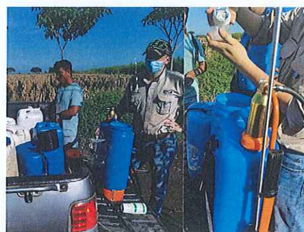
Anexo. 10. Capacitación acerca del manejo, mantenimiento, calibración del equipo de aplicación y elaboración de mezclas químicas.