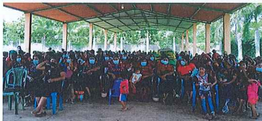
Anexo. 4. Asamblea y exposición de plan de inversión.