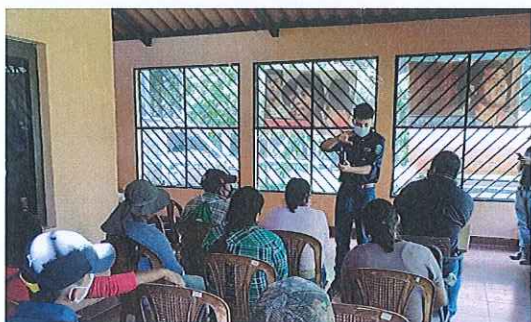
Anexo. 5. Capacitación mediante la técnica empleada a grupos operativos "dramatización" dirigida a la comisión de bosque energético.