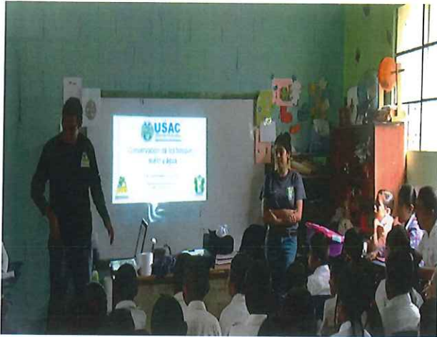
Figura 5. Charla informática de la importancia del bosque, suelo en la EORM "La Montañita"