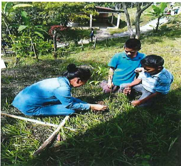
Figura 3. Reforestación con los niños de la EORM "La Montañita "