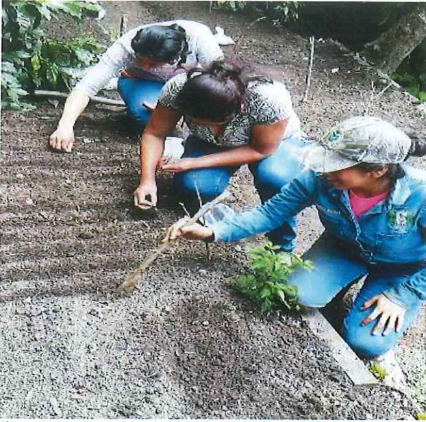
Figura 1. Siembra de hortalizas con las mujeres de la comunidad La Montañita