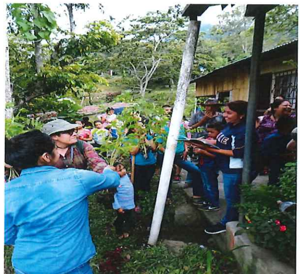
Figura 4. Entrega de Plantas de Caoba ( Swietenia macrophylla ) padres de familia en la EORM La Montañita "