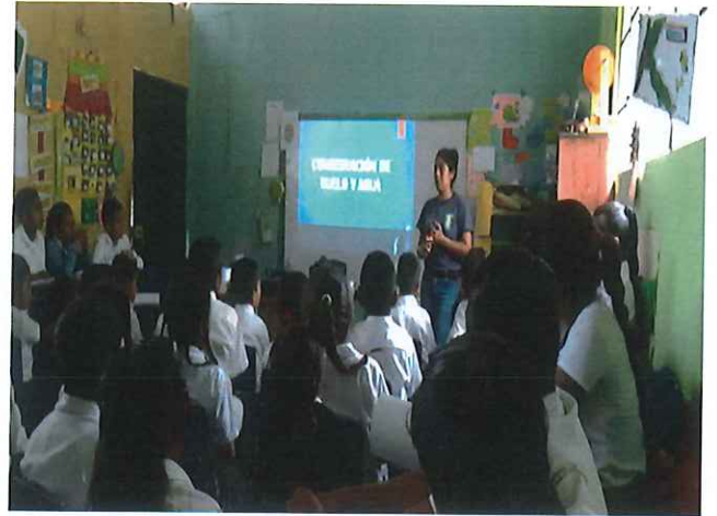
Figura 6. Actividad de preguntas durante la Charla agua y informática en EORM "La Montañita"