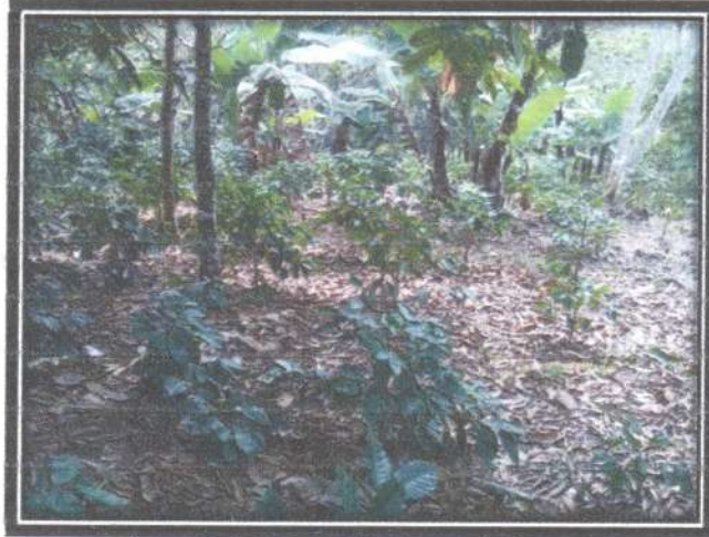
Figura 2. Zona cubierta con cafetales.