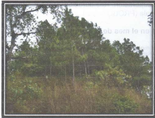
Figura 5. Plantación de rodal 12 de Pinus oocarpa .

Bosque Natural La sección de bosque natural (zonas cubiertas con vegetación natural del lugar) ocupa 92.21 Ha, lo cual representa el 50.6% del total de área del sector "A" de la finca. Para 2019 las autoridades de ENCA planean realizar diversos proyectos de restauración y protección, además de aplicar el Plan Operativo Anual (POA) 2019 de la ENCA, el cual abarca seis metas estratégicas para la institución: