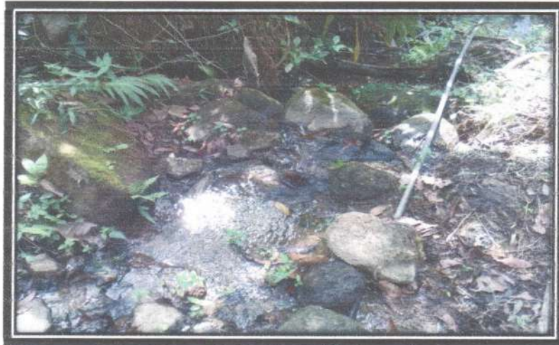
Figura 6. Quebrada "El Mango"