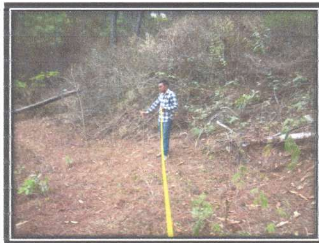
Figura 9. Medición de 5 m de ancho de la carbonera