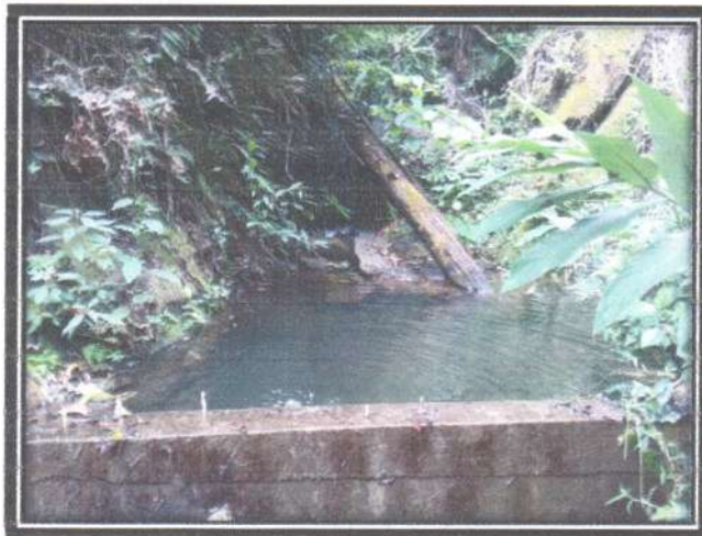
Figura 7. Tanque de captación de agua en riachuelo "El Castellano"