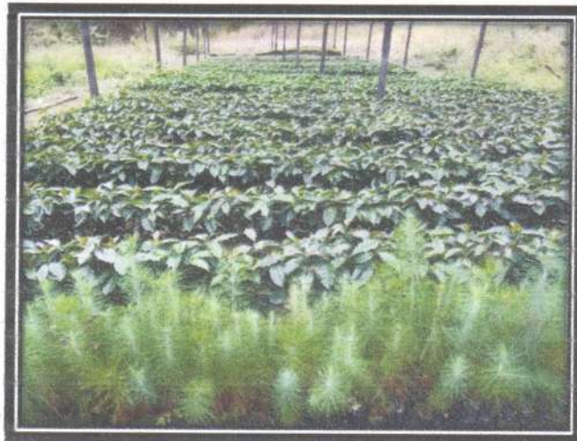
Figura 3. Vivero agroforestal de sector "El Plan"