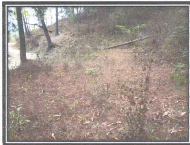
Figura 8. Lugar en que se construirá la carbonera