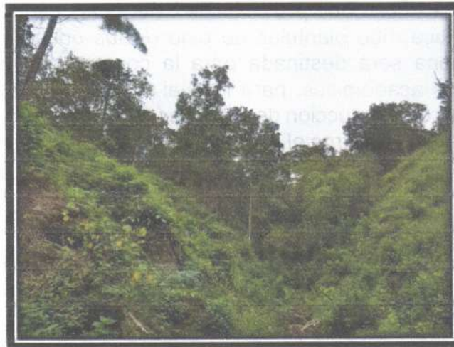
Figura 4. Guatales en sector de plantación de cedro.