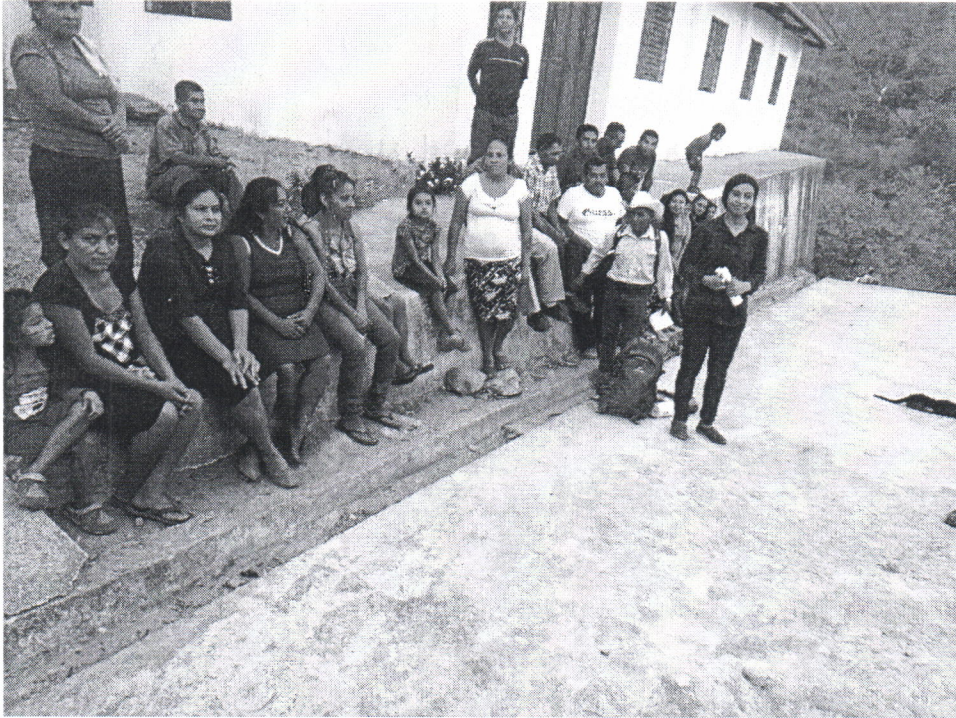
Figura 1. Presentación plan de extensión rural para la comunidad Conacaste