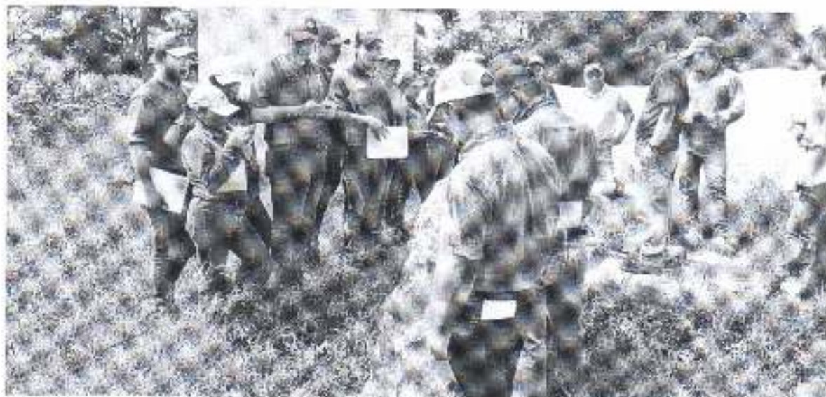
Fotografía: Aforo a pozo de hortalizas, junto con alumnos del curso de estudio del agua y sistemas de riego.