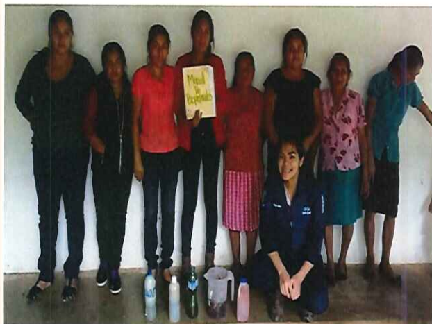
Figura 6. Capacitación elaboración de biopreparados.