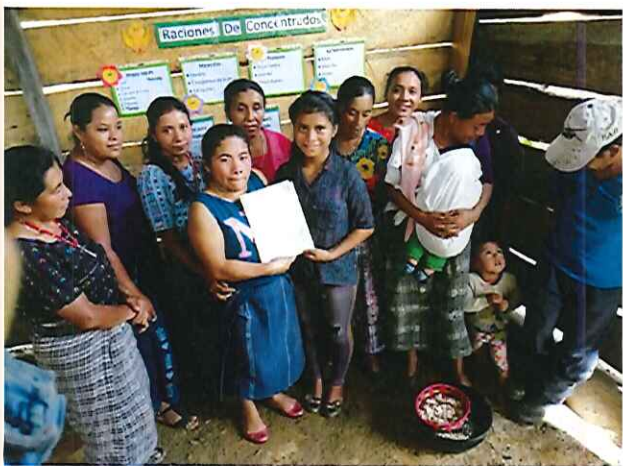
Figura 10. Entrega de manual de elaboración de concentrados orgánicos para gallinas y pollitos.