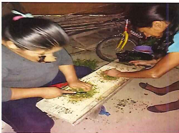
Figura 7. Elaboración de repelente a base de flor de muerto.