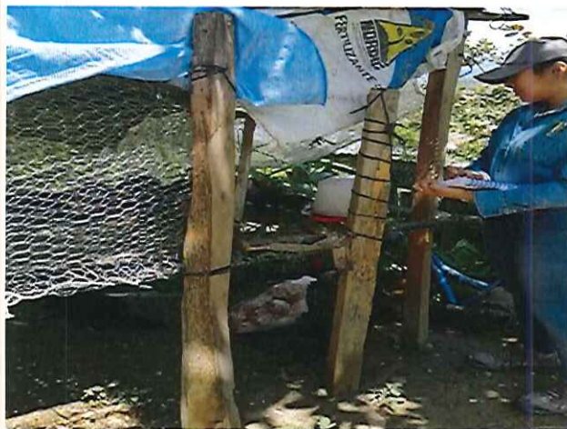
Figura 8. Realización de censo de gallinas ponedoras, gallinas de engorde y pollitos.