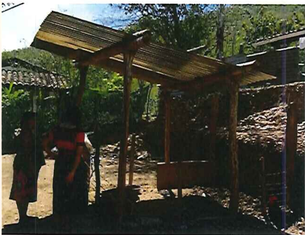
Figura 4. Monitoreo, avance en la construcción de cochiguera.