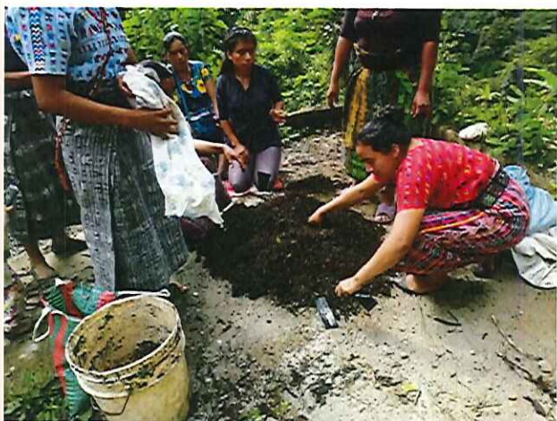
Figura 9. Realización de vivero de moringa.