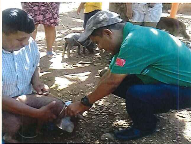
Figura 2. Jornada de vitaminación.