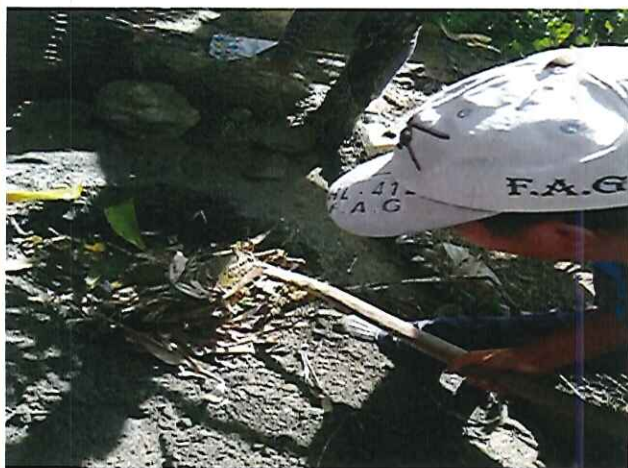
Figura 5. Elaboración de abonera.