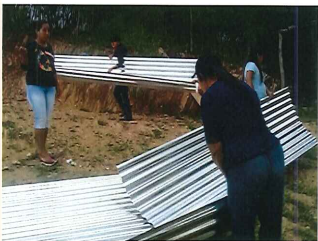
Figura 3 entrega de láminas para la construcción de cochiguera.