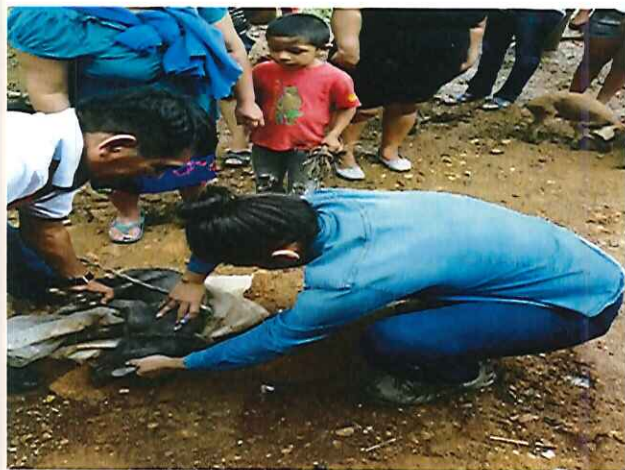
Figura 1. Jornada de desparasitación.