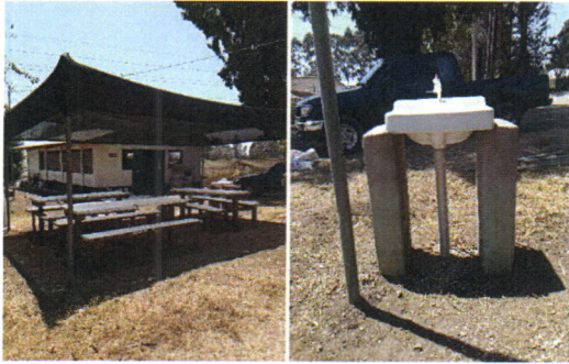
Figura 1. Instalación de lavamanos en comedor en el área de hortalizas