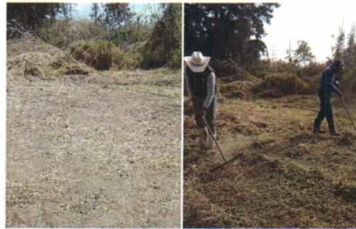
Figura 2. Limpieza en el terreno para habilitar abonera.