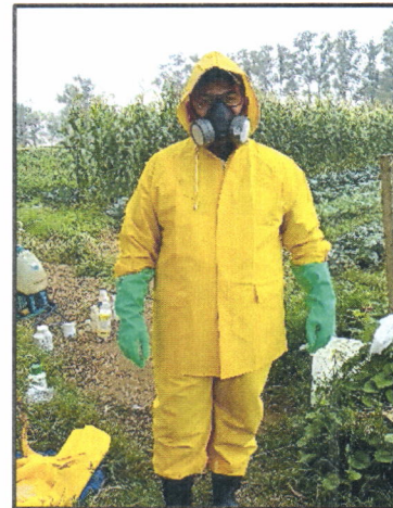
Figura 4. Uso correcto del equipo de protección recomendado para las aplicaciones de productos químicos en campo.