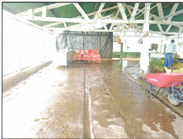
Figura 3. Limpieza y lavado del área de empaque de hortalizas.