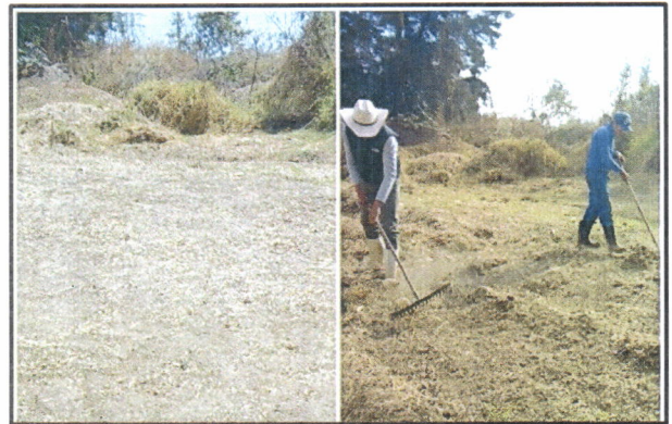
Figura 2. Limpieza en el terreno para habilitar abonera.