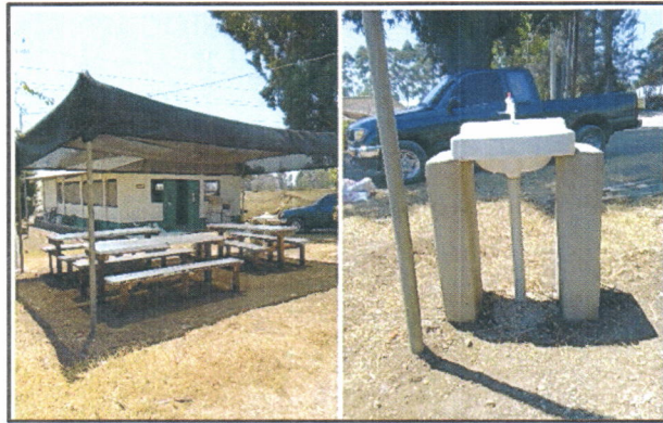
Figura 1. Instalación de lavamanos en comedor en el área de hortalizas.