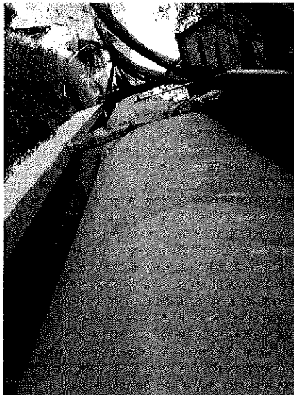
Figura 5. Biodigestor del área de producción animal