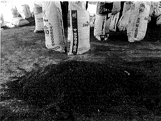
Figura 1. Recolección de pollinaza