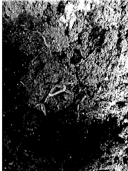
Figura 3 y 4. Camas de lombricultura.