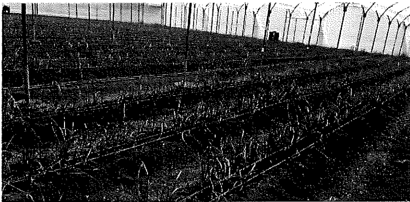
Figura 7. Producción de cebolla bajo invernadero.