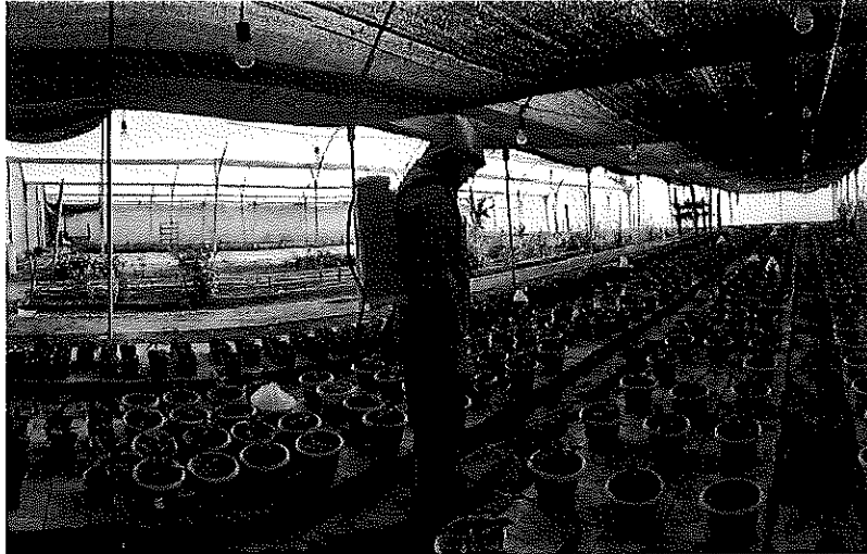
Figura 2. Aspersión de fungicidas en el cultivo de pascua.