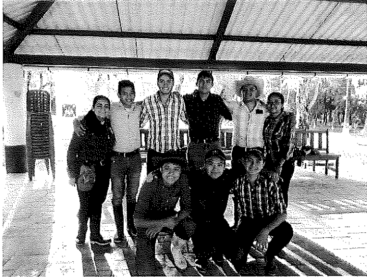
Figura 6. Grupo de estudiantes del módulo de hortalizas bajo condiciones controladas.