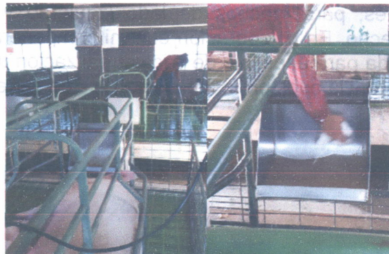
Limpieza de jaula y comedero del área de maternidad

Realizar limpieza en los corrales de los animales de destete cuando estos salen a engorde.