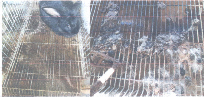
Jaulas con acumulo de heces y pelo