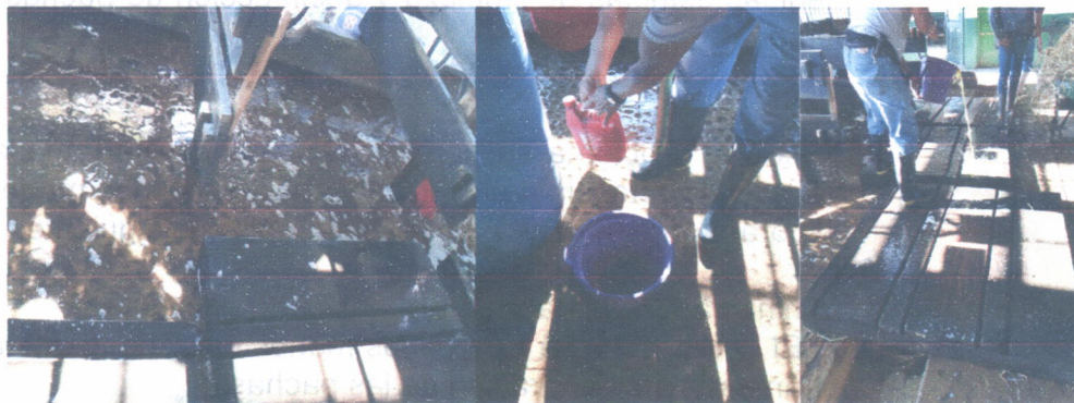
Limpeza y desinfección de cunas

Estas medidas ayudaron mucho a que los problemas de diarrea disminuyeran, hasta el momento no se han reportado casos.