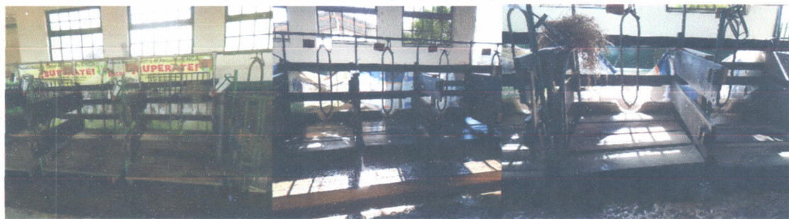
Área de cunas limpias