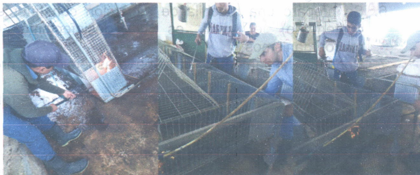
Flameo en módulos de conejos.