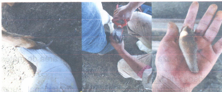
Recorte de pezuñas en ovejas.

En el área de ovinos se realizó el recorte de pezuñas en veinte ovejas esto con apoyo del estudiante del Trabajo Profesional encargado del área, es importante realizar esta actividad ya que si una oveja no desgasta la pezuña pueden surgir problemas como pododermatitis en incluso problemas articulares que dificultan la locomoción. También se realizó la identificación de cuatro terneros, para esto se les colocaron aretes, para machos de lado izquierdo y para hembras en lado derecho. En colaboración con mi compañera de zootecnia se brinda ayuda para el pesaje de vacas, realización de alimento balanceado y asistencia a los profesionales en lo que se requiera.