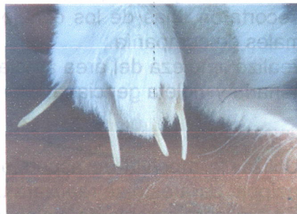
Uñas largas en conejos.