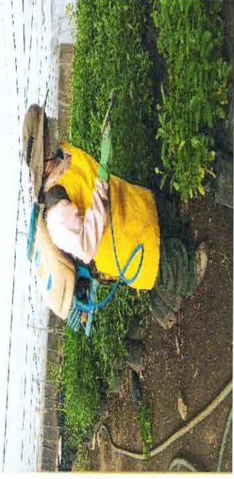
Imagen 4. Colocación de cinta especial al injerto de limón real con un patrón de limón persa.