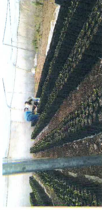
Imagen 2. Siembra directa de plántulas de limón en bolsas de vivero y tierra homogenizada

Imagen 1. Apoyo con la supervisión de estudiantes de segundo año de la ENCA en el vivero de frutales.