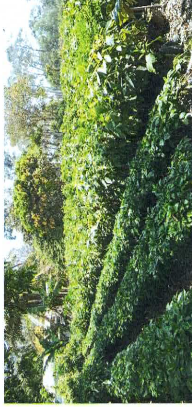
Imagen 10. Apoyo a el área de producción de frutales en realizar un inventario de varias especies como: Aguacate, café, macadamia, mango entre otras.