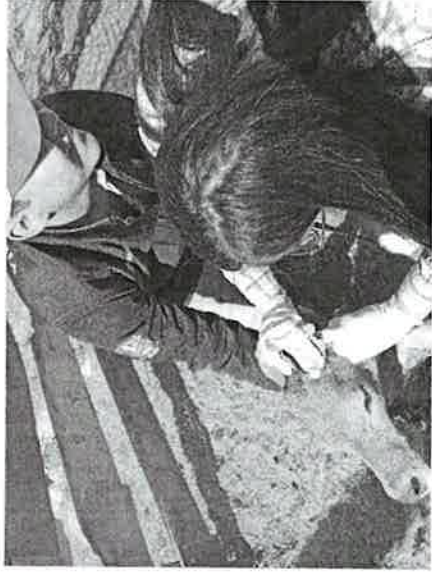
Imagen 2. Descorne en terneros