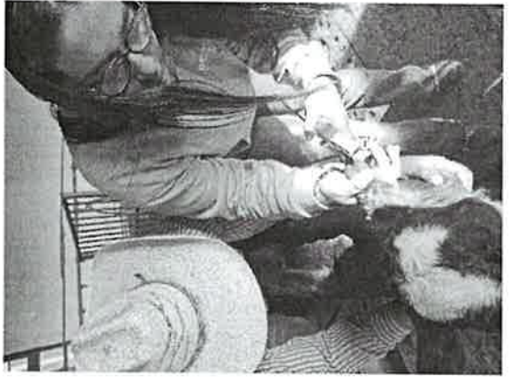
Imagen 3. Areteo de terneros