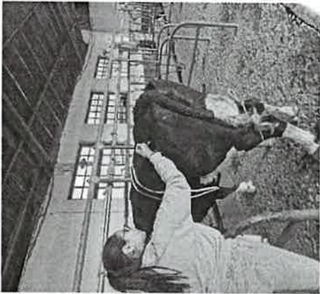
Imagen 1. Tratamiento postparto