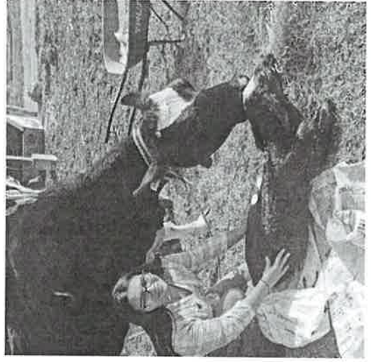
imagen 4. Atención a partos