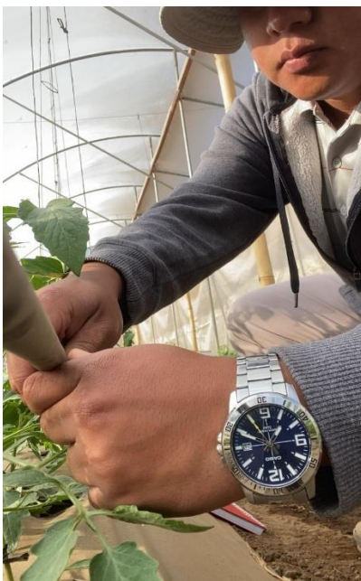
Figura 22. Evidencia de corrección y limpieza del equipo mal colocado.