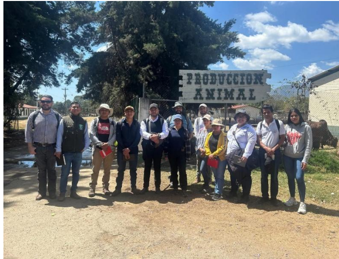
Figura 1. Recorrido por las instalaciones de la -ENCA-