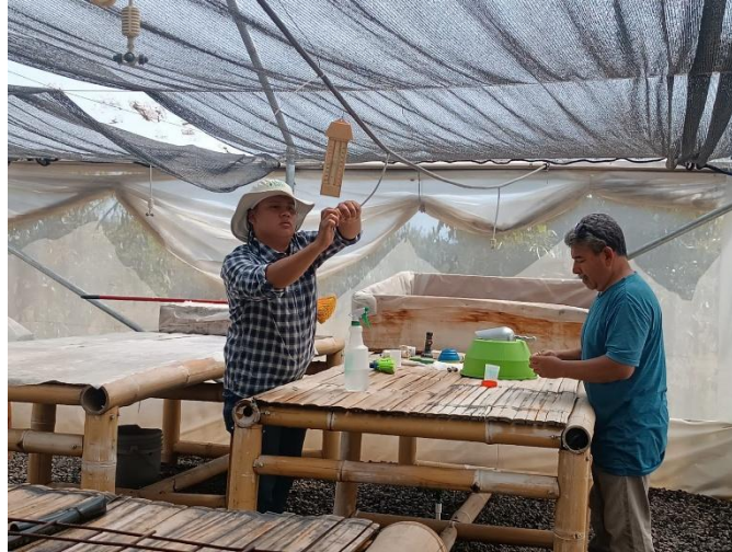
Figura 6. Limpieza de boquillas obstruidas en el área de propagación.