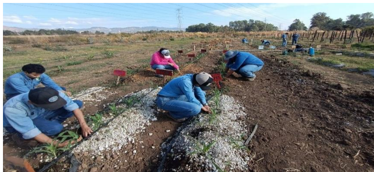
Figura 9. Revisión de parcelas y apoyo técnico.

Los estudiantes acudieron a las parcelas asignadas para continuar con la toma de datos, deshierbe, aplicación de fertilizantes, fungicidas y, en caso necesario, insecticidas. Previamente, se definieron las actividades con un día de antelación, y los grupos ejecutaron las tareas conforme a su criterio para el desarrollo de la investigación. Se les indicó la obligatoriedad de llenar las hojas fitosanitarias correspondientes a cada aplicación.