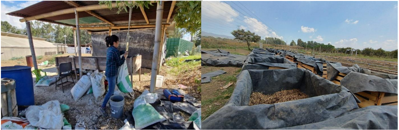
Figura 7. Apoyo a la compañera de recursos naturales.