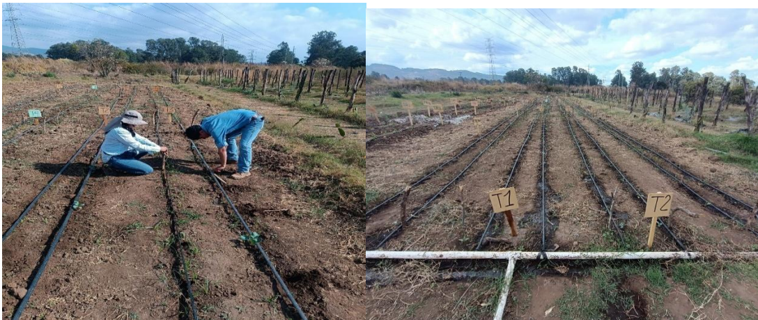
Figura 8. Resiembra de plantas de brócoli

A pesar de ello, se aplicó un fertilizante foliar y un enraizador para mantener las plántulas en buen estado. Aunque no se observaron insectos a simple vista, se continúa monitoreando. Además, se detectaron plantas con síntomas de virosis, situación que se comunicó a los estudiantes. En la parcela de brócoli se realizó la cuantificación de plántulas y se registraron pérdidas, datos que posteriormente se compartieron con los estudiantes. En el caso de las lombrices, se evidenció un estado óptimo debido a su reproducción, manteniendo un control adecuado de humedad y riego. En el sistema milpa, se verificó el riego sin que se presentaran problemas de germinación.