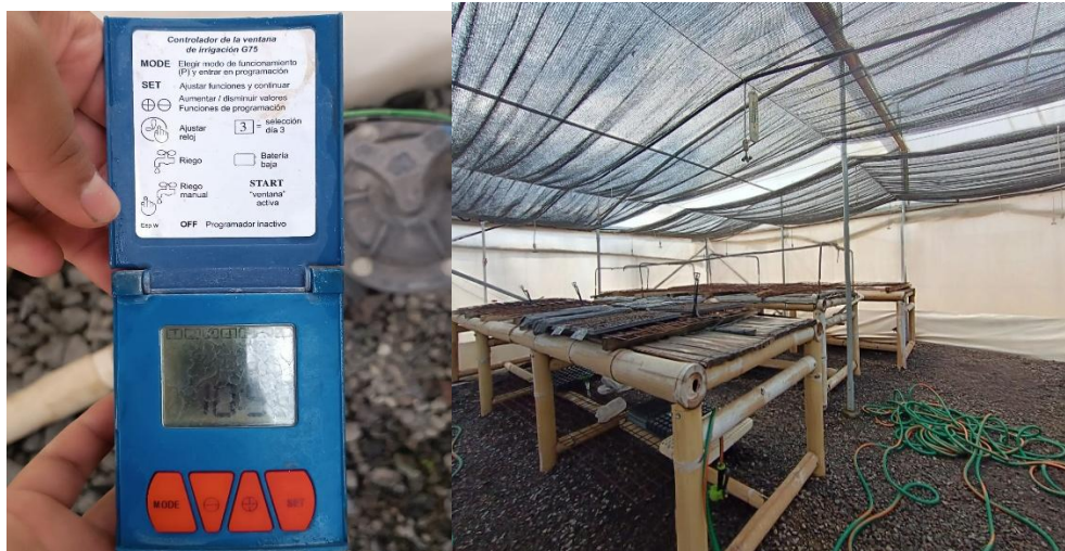
Figura 5. Proceso en la plantación de semillas de Jamaica