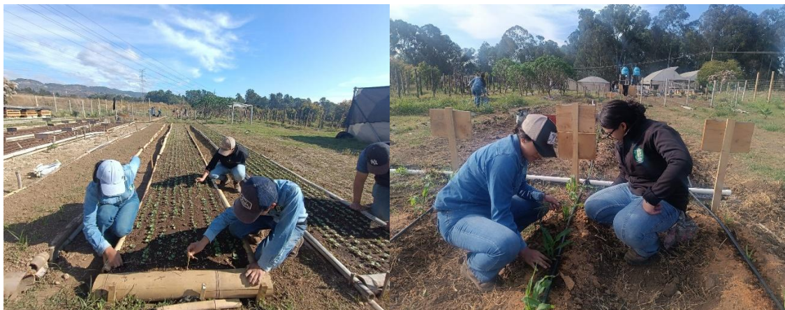
Figura 9. Continuación con las actividades técnicas en las parcelas experimentales.