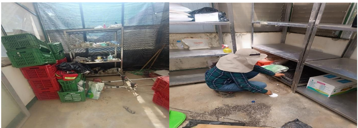
Figura 2. Limpieza en el área de invernadero de cristal