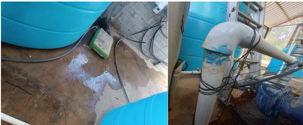
Figura 10. Reparación de tubería principal y el uso de herramientas en el campo

A partir de ese momento, mi compañero y yo estaremos a cargo de la unidad de investigación, lo que implica que ya no se contará con mano de obra externa. Durante las últimas semanas, el personal del MAGA brindó asesoramiento sobre las herramientas disponibles en el área, entre ellas chapeadoras y un rotovator de 7 HP.