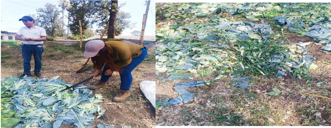
Figura 3. Realización del picado de desechos en la abonera