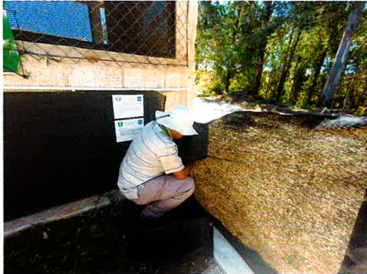
Figura 7 Readecuación de camas biológicas (reparaciones).