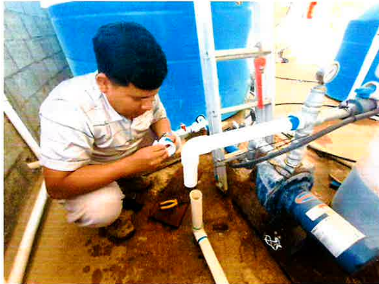
Figura 4 Reparación del sistema central de riego.