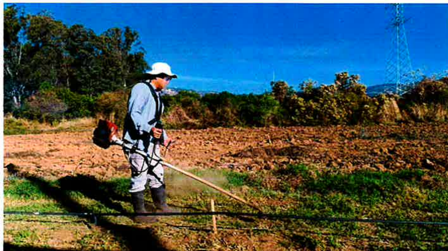
Figura 5 Desmalezado de la periferia del proyecto.

Debido al inicio de la época lluviosa se tiene una mayor presencia de malezas en la periferia del proyecto, las actividades constantes también constan del desmalezado de manera mecánica utilizando la moto guadaña en las áreas específicas del proyecto que no lleguen a afectar al cultivo que son parte de las investigaciones establecidas.