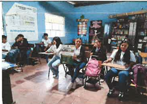
Anexo 3: Estudiantes del INEB de Telesecundaria, Aldea La Paz I, Salamá, B.V.