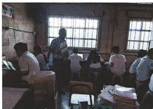
Anexo 5: Estudiantes del INEB de Telesecundaria, Barrio Agua Caliente, Salamá, B.V.