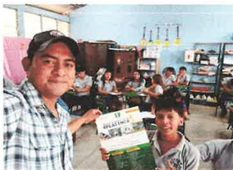
Anexo 4: Estudiantes del INEB de Telesecundaria, Aldea Tempisque, Salamá, B.V.