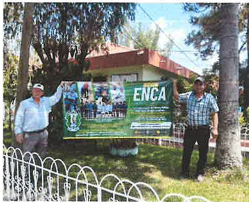
Anexo 1: Manta vinilica instalada en la Dirección Departamental de Educación de Baja Verapaz.