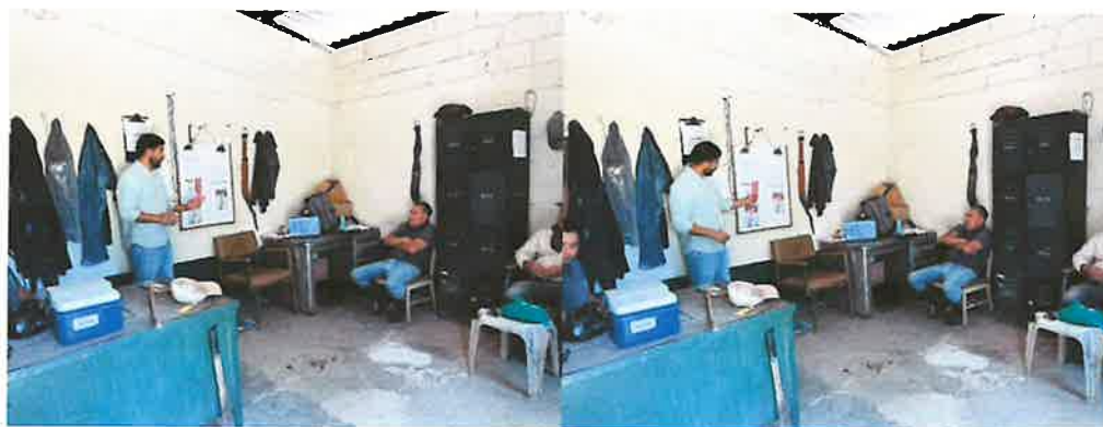
Figura 1. Capacitación IAPC cerdas multíparas

Entre los temas abordados se incluyeron el ciclo estral de la cerda, detección de celo, métodos de inseminación artificial post-cervical, así como la importancia de la higiene y lubricación durante el procedimiento. Además, se brindaron recomendaciones prácticas para realizar una correcta técnica de inseminación y reducir riesgos de contaminación o lesiones en las hembras. La actividad permitió fortalecer los conocimientos técnicos del personal encargado del área, promoviendo mejores prácticas durante el proceso de inseminación artificial.