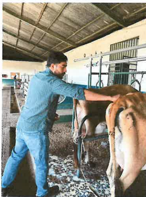
Figura 2. Administración vitaminas vacas post-parto

El tratamiento consistió en la aplicación de dos dosis por animal, con un intervalo de tres días entre cada administración. La administración del complejo B tuvo como finalidad contribuir a la recuperación de las vacas durante el periodo post-parto, favoreciendo el metabolismo energético, estimulando el apetito y ayudando a disminuir el estrés generado después del parto. Asimismo, estas vitaminas apoyan el buen funcionamiento del sistema nervioso y ayudan a mantener una adecuada condición corporal en los animales. Esta actividad permitió brindar atención preventiva a las vacas en etapa post-parto, promoviendo mejores condiciones de salud y recuperación en los animales tratados.