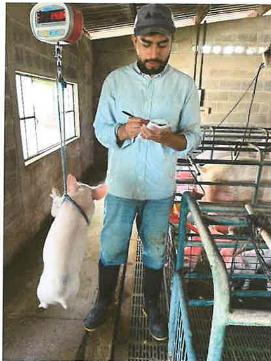
Figura 11. Pesaje lechones destete

El procedimiento se llevó a cabo de manera adecuada, garantizando una correcta transición de los lechones y el cumplimiento del manejo sanitario establecido. Durante el mes de mayo se realizó el destete de un total de 19 camadas.