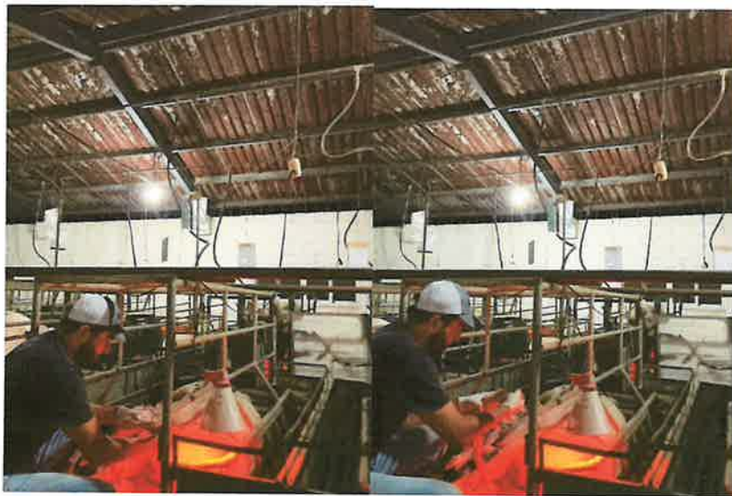
Figura 6. Asistencia parto cerda 818

Una vez iniciado el parto, se verificó el correcto nacimiento de cada lechón y el tiempo transcurrido entre cada expulsión, con el objetivo de identificar posibles complicaciones de manera oportuna. En aquellas cerdas que presentaron demora excesiva entre nacimientos o dificultades durante el proceso, se realizó la intervención correspondiente, ayudando a la movilización y acomodación de los lechones para facilitar su salida. Asimismo, cuando fue necesario, se efectuó la palpación para extraer lechones que obstruían el canal de parto.