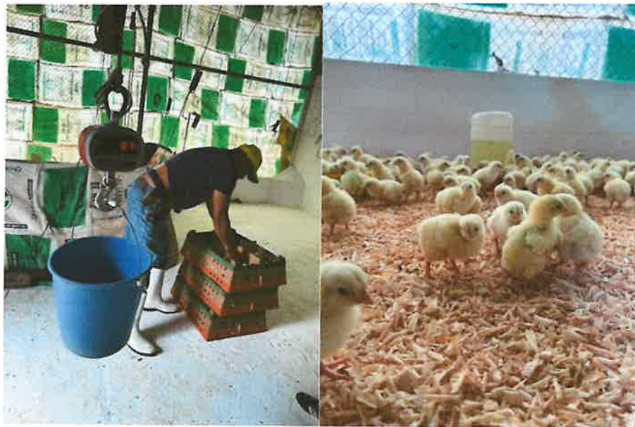
Figura 3. Recepción de pollito

Se recibió el lote 06-25 conformado por 511 pollitos de la línea genética Ross, con un peso inicial promedio de 44.49 gramos, así como el lote 07-25 integrado por 503 pollitos de la misma línea genética, con un peso inicial promedio de 43.58 gramos.