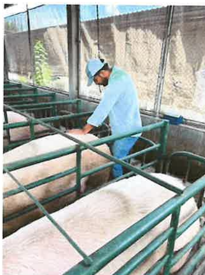
Figura 9. Inseminación artificial post-cervical cerda múltipara

Finalmente, se registraron los datos correspondientes de cada animal, incluyendo el número de la cerda, la fecha de inseminación y el verraco donador utilizado. Esta actividad se llevó a cabo en cerdas que presentaron celo durante las semanas 19, 20, 21 y 22 del mes de mayo.