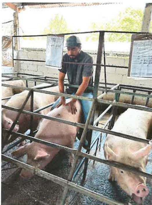
Figura 10. Detección de celo cerdas multíparas

La evaluación se realizó considerando principalmente a las cerdas según la fecha de inseminación y el posible retorno al celo. De igual manera, se incluyeron las cerdas recién destetadas, las cuales fueron revisadas aproximadamente cinco días después del destete. Cada animal fue evaluado individualmente aplicando presión sobre el lomo para comprobar la presencia del reflejo de inmovilidad. Las cerdas identificadas en esta etapa fueron registradas en sus respectivas hojas de control, anotando la fecha de retorno, y posteriormente trasladadas a las jaulas destinadas para una nueva inseminación artificial. Se brindó apoyo en las actividades de detección de celo durante las semanas 19, 20, 21 y 22 del mes de mayo.