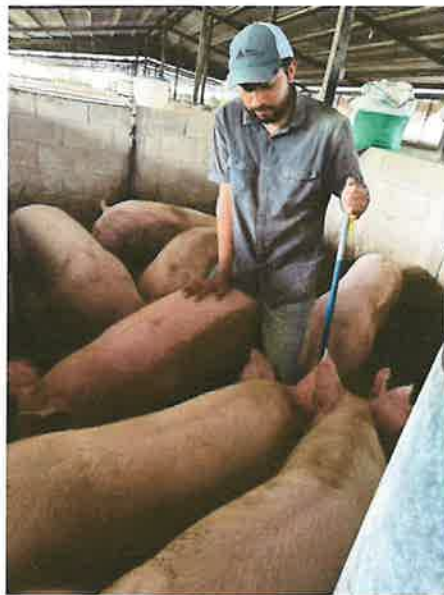
Figura 5. Detección de celo cerdas de reemplazo

Durante la evaluación se detectó el primer celo en dos cerdas del corral 5 identificadas como F y G, además del tercer celo en la cerda identificada con la letra C. De igual manera, las cerdas D y E presentaron segundo y tercer celo, respectivamente, y al confirmar que cumplían con el peso requerido fueron trasladadas a las jaulas de gestación para realizar su primera inseminación artificial.