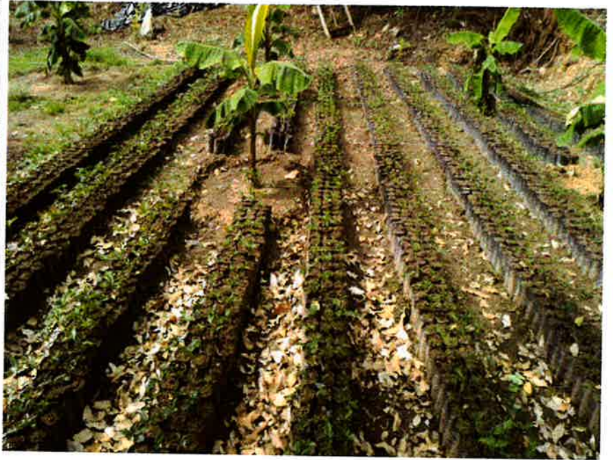
Capacitación ..instituto de telesecundaria área Conacaste